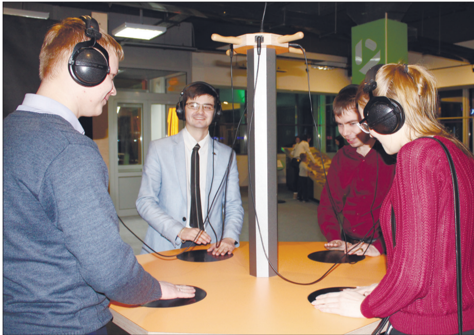
Совместное создание ритма на барабанном столе

Не так давно в нашем г. Альметьевск открылся Швейцарский научный центр TECHNORAMA, куда и пошла наша молодежь утолить свой неумный интерес и просто весело, в сочетании с пользой, провести время. Нашему вниманию были представлены экспонаты из серий «Отраженный разум» и «Музыкальные ландшафты». Удивительные миры музыки и зазер-